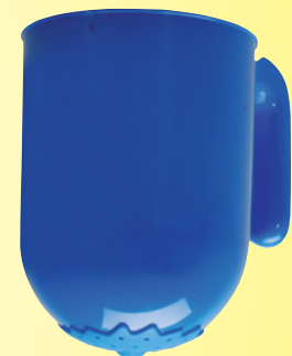
556-62 Gießkanne 0,5L Größe: ca. 25 x 12 x 17 cm